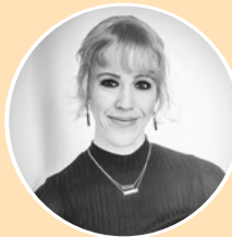
Irma Pennekamp Redactie