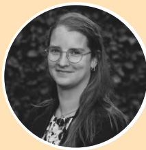
Paulien Rijnveld Redactie