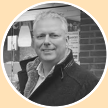
Andy Arnts Uitgever & verkoop

Ons fonds biedt een prikkelende mix van romans, thrillers, non-fictie, zingeving en sciencefiction. Daarnaast zijn we in 2025 gestart met de serie September Classics , waarin we literaire pareltjes die inhoudelijk nog altijd actueel zijn, opnieuw laten schitteren. Deze klassiekers bewerken we tot toegankelijke edities, waarin taal en verteltempo weer helemaal aansluiten bij het lezerspubliek van nu.