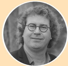
Jeroen Sweijen Redactie

Uitgeverij September | Postbus 709 | 3900 AS Veenendaal